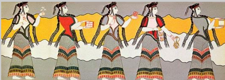
Τοιχογραφία Θήβας, 14ου - 13ου αι. π.Χ.