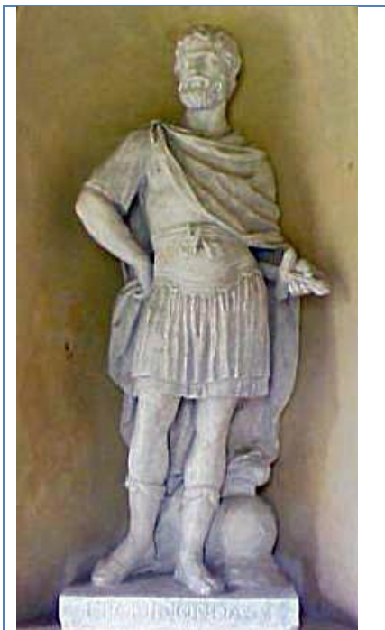
Άγαλμα του Επαμεινώνδα στο Στόου του Μπάκιγχαμσαίρ

Το 375 π.Χ. οι Θηβαίοι εισέβαλαν στον Ορχομενό, τον οποίο υπερασπίστηκαν οι Σπαρτιάτες. Οι δύο στρατοί συγκρούστηκαν στη γειτονική πόλη Τέγυρα και στη μάχη που ακολούθησε οι Θηβαίοι επικράτησαν. Επικεφαλής των Θηβαίων σε αυτή τη μάχη ήταν ο Πελοπίδας. Το 372 π.Χ. κατέλαβαν για μία ακόμα φορά τις Πλαταιές και την επόμενη χρονιά τις Θεσπιές ολοκληρώνοντας την ανάκτηση της ηγεμονίας τους σε ολόκληρη τη Βοιωτία. Οι κινήσεις αυτές των Θηβαίων όμως οδήγησαν σε δημιουργία συνασπισμού εναντίον τους που αποτελούσαν από τους Αθηναίους και τους Σπαρτιάτες. Οι Σπαρτιάτες με επικεφαλής τον Κλεόμβροτο βάδισαν εναντίον της Θήβας και οι δύο αντίπαλοι συγκρούστηκαν στα Λεύκτρα